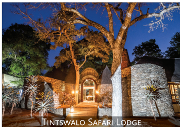
TINTSWALO SAFARI LODGE