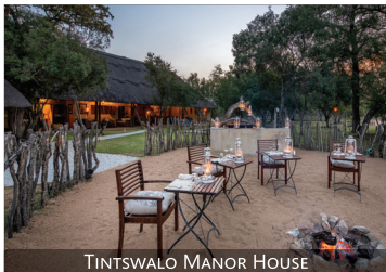
TINTSWALO MANOR HOUSE